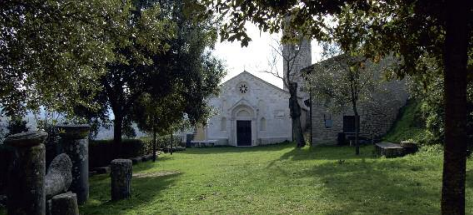
In alto, chiesa di Santa Vittoria a Monteleone Sabino

tanti entreranno 35mila euro l'anno per 25 anni, al comune 5 mila euro l'anno, sempre per 25 anni. Insomma, noi davvero possiamo dire che ci siamo mossi in direzione federalismo con un anno e mezzo di anticipo».