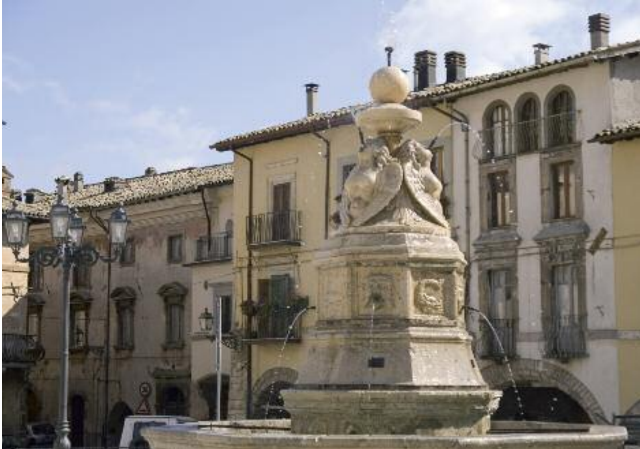
Sopra, fontana sulla Piazza di Leonessa

pivano che la bellezza della città ereditata era importante e fondamentale. Un altro problema enorme lo spiego con altri due esempi banali: se l'Abbazia di Farfa o Vescovio fossero trasportate in Umbria avrebbero ben altro valore, abbiamo dei monumenti che hanno una dimensione mondiale, però non c'è promozione perché il numero di abitanti è basso e la politica risponde 'Ma quanti voti sono!' Un ragionamento miope».