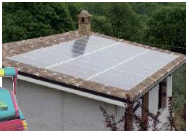
Pannelli fotovoltaici per sfruttare l'energia solare

POGGIO MIRTETO, LOCALITÀ CAPACQUA RI 02047 TEL/FAX 0765 26202 • CELL. 335397915 • E-MAIL: marcorpa@libero.it