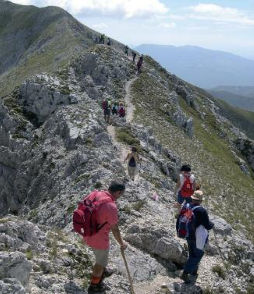
Passeggiate del CAI sul Terminillo