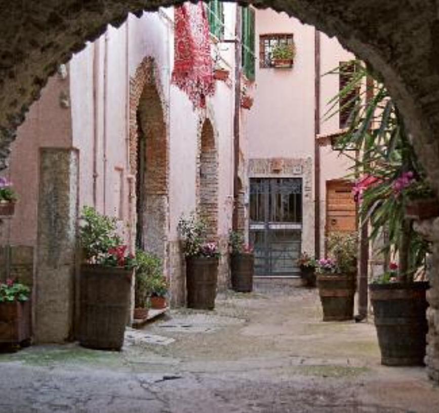
Un caratteristico vicolo della Sabina

tità. Il Comitato per il Territorio della Regione (ente preposto alla valutazione preliminare che anticipa il giudizio di giunta e del consiglio) valutandola emette un documento che è l'esatto 'copia e incolla' della variante redatta dal Consorzio, nel quale si parla di modifiche di lieve entità. Quando arriva poi in Giunta e infine al Consiglio, viene dunque approvata, anzi si evidenzia che la variante sarebbe addirittura stata concepita per preservare una villa romana».