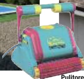
Impianti di irrigazione e sollevamento acque