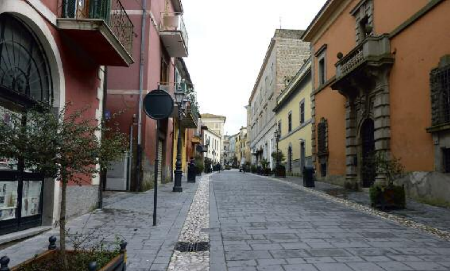
In alto, vicolo di Magliano Sabina

gente. E su questo aspetto va anche messa in luce la politica della gestione della funivia che, secondo me, è alquanto discutibile. I prezzi sono quelli che possiamo trovare sulle Alpi, non sono previste riduzioni per i bambini, una tariffa giornaliera si aggira sui 25 euro e una per il pomeridiano sui 20 euro. Il rapporto prezzo-offerta è squilibrato e fuori da ogni competizione».