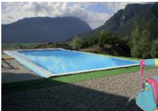
Piscine interrate e prefabbricate prodotti chimici accessori